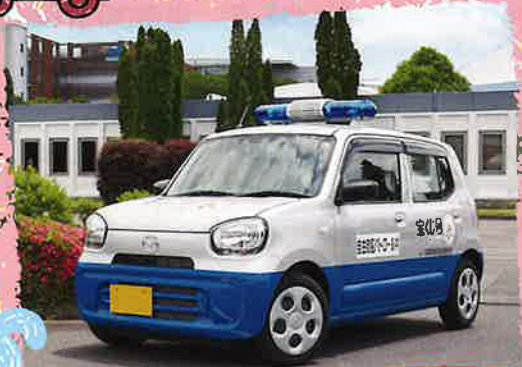
あかいろうかいてんとう そうびしや 青色回転灯装備車