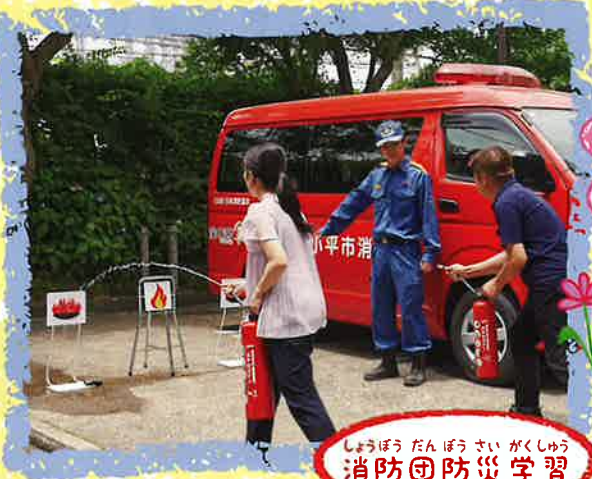
しょうぼう だん ぼうさい がくしゅう 消防団防災学習