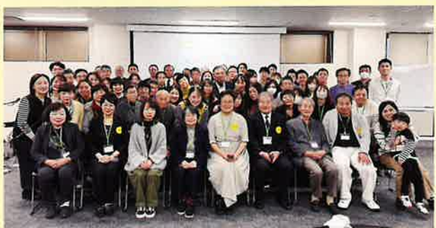
昨年の大会の第2部終了後 集合写真

今年も、11月29日（土）と30日（日）の一泊二日で、トーセイホテル&セミナー幕張にて開催します。参加方法などはハートバンドのHPにてご確認下さい。