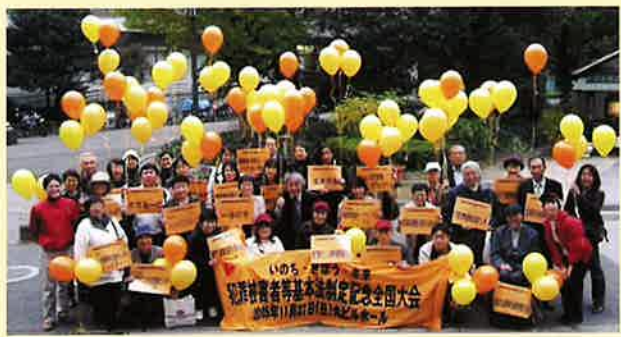
※結成直後に開催された「犯罪被害者等基本法制定記念全国大会」のパレード (2005年11月)