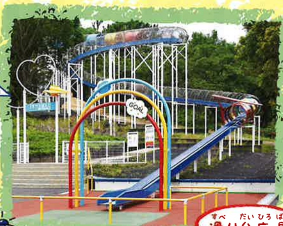
すべ だいひろば 滑り台広場