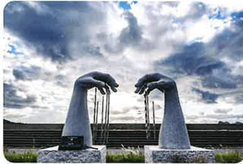
DOMMUNE Presents [LANDSCAPE MUZAK]PROJECT SADO#1 テリー・ライリー [Wakarimasen]

芸術の島を象徴するアートの祭典。海辺や自然、歴史的建造物などを舞台に、国内外のアーティストが作品を発表します。2025年は春・秋・冬に開催され、展示に加えて伝統芸能や食体験のツアーも登場。アートを通じて佐渡の新しい魅力に出会える祭典です。