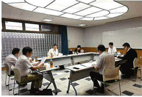
奨学生選考委員会

令和七年度第一回奨学生選考委員会が、九月一日に開催され、新たに奨学生九名（園児一名・小学生四名・中学生四名）が採用されました。当基金発足以来これまでに二千二百四十五名を採用いたしました。