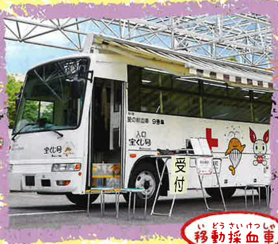
い どうさいけつしや 移動採血車