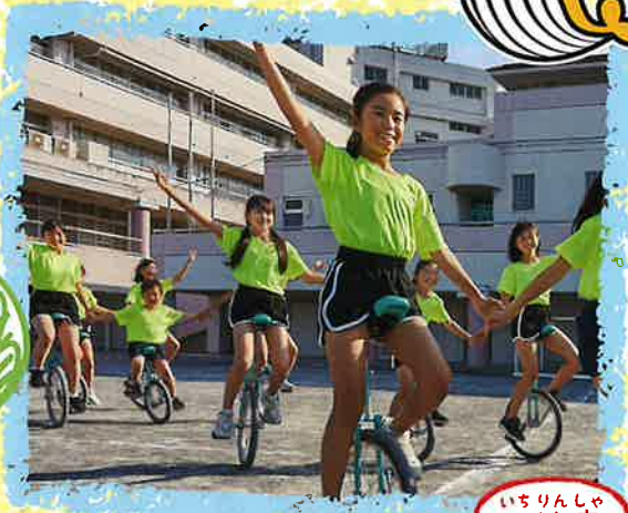
いちりんしや 一輪車