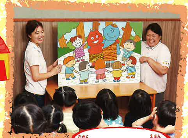
たから 宝くじドリームジャンボ絵本

たから 宝くじは、図書館や動物園、学校や公園の整備をはじめ、 さいがい つよ まち 災害に強い街づくりまで、みんなの暮らしに役立っています。