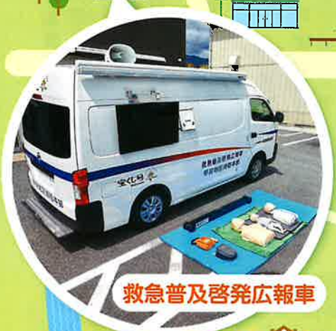
救急普及啓発広報車