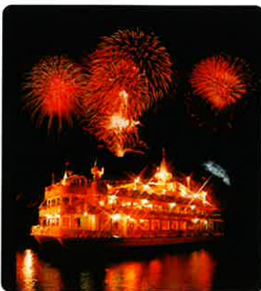
ロングラン花火と湖上遊覧船