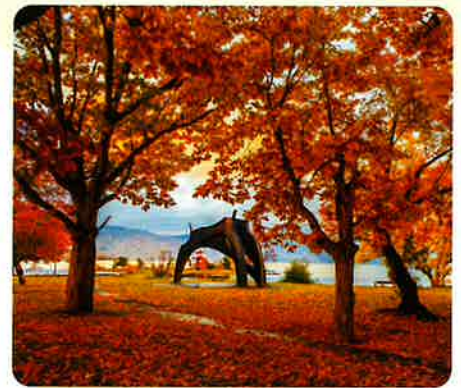
洞爺湖（秋）湖畔の彫刻

また、令和3年7月には史跡「入江・高砂貝塚」が「北海道・北東北の縄文遺跡群」の構成資産として世界遺産に登録され、既にユネスコ世界ジオパークに認定されている「洞爺湖有珠山ジオパーク」と合わせて2つの「ユネスコ遺産」を有しているほか、洞爺湖畔には58基もの彫刻作品が展示されているなど、自然と文化、芸術が調和した町並みとなっています。