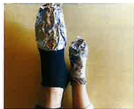
靴下の上からつま先を覆うように巻きつけ手で押さえてフィットさせてください。

冬場に足先が冷えて困った経験をした方も多いのではないのでしょうか。そんな時は靴下の上から足にアルミ箔を巻いて、更にその上に別の靴下を重ね履きしてみてください。輻射（ふくしゃ）熱でホカホカになり冷えを緩和することができます。災害時など、もしものときのために。参考にしてください。