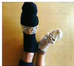
更にその上から別の靴下を履いてください。