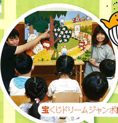
宝くじドリームジャンボ絵本