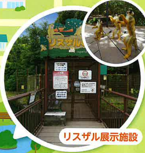
リスザル展示施設

宝くじは、少子高齢化対策、災害対策、公園整備、 教育及び社会福祉施設の建設改修などに使われています。