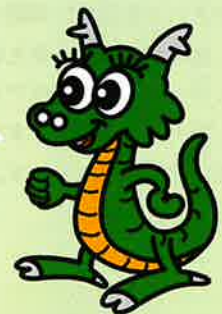
洞爺湖町ロゴマーク 「洞龍くん」