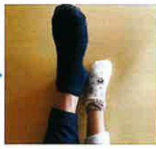
あまり歩き回るとアルミ箔がパラパラになるので注意してくださいね・・・