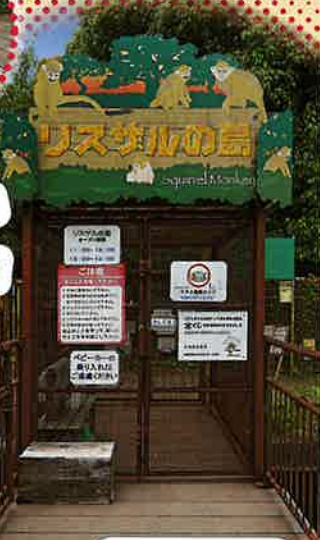
てんじしせつ リスザル展示施設