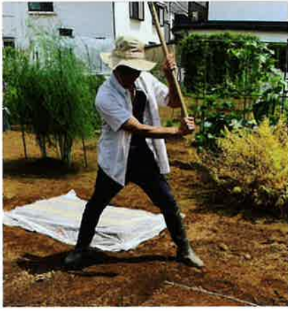
レギュラー番組『趣味の園芸やさいの時間』より

やっていることは結婚して十七年変わっていないけど、家族を守る、妻を大事にする、仕事は真面目にやる。周りに何と言われようが仕事は真面目にやるし、どれだけ言われようが家族を守るし、妻を守る。徹底し