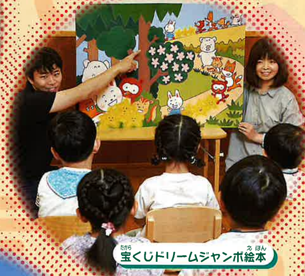
さくら 宝くじドリームジャンボ絵本