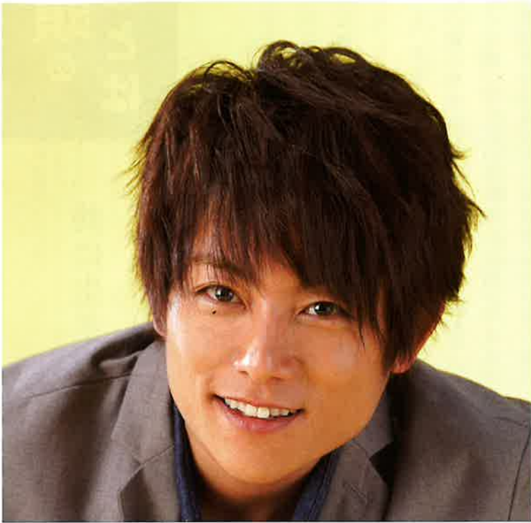
俳優・タレント 杉浦 太陽さん

二〇〇一年『ウルトラマンコスモス』の主演で注目された杉浦太陽さん。以降、多数の映画やドラマに出演。バラエティ番組でも活躍し、二〇〇七年には元モーニング娘。の辻希美さんと結婚し話題となりました。理想のパラシキング一位や「いい夫婦パートナー・オブ・ザ・イヤー」受賞など、さわやかなイメージが共感を呼んでいます。仕事への向き合い方、転機、今後の展望等をお聞きしました。