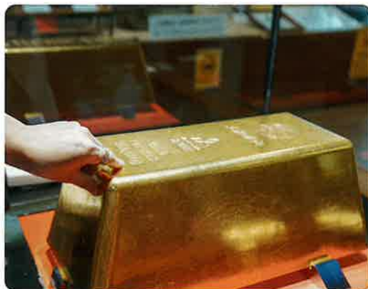
土肥金山の巨大金塊

「黄金KAIDO」は、新潟県の「佐渡金山」、長野県の「金鶏金山」、山梨県の「湯の奥金山」、静岡県の「土肥金山」を結ぶ陸路と海路のルートのことだ。