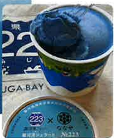
駿河湾ジェラート No223