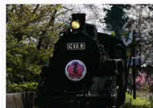
表紙：静岡県 大井川鐵道

1942年、東京日本橋に生まれる。22歳の時、小さい頃から好きだった絵や詩を書くことを決め、絵の学校セツ・モードセミナーに入学。翌年、東京写真専門学校に入学し、近所の喫茶店の壁を借りて第1回個展を開催。30歳の時、日本各地を旅し個展を開催する。第一集「ひとりぼっちの愛の詩」100部を自費出版し、現在まで約50万冊発行。その後、約10年間アメリカをはじめ世界各国を旅し、50歳ごろまで猛烈に作品と詩集の制作に取り組む。1992年日本テレビ「ズームイン!!朝」の出演の為、熊本県阿蘇郡小国町を訪れた際、大自然の素晴らしさに感動し、「作品館」アトリエ「美術館」を作る。現在も日本各地を訪れ展覧会と講演会を開催しながら詩・絵・書・油絵・陶器の制作を続けている。