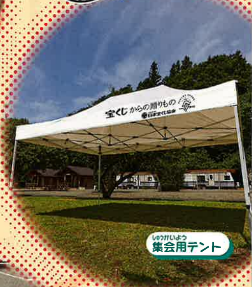
しゅかいよう 集会用テント