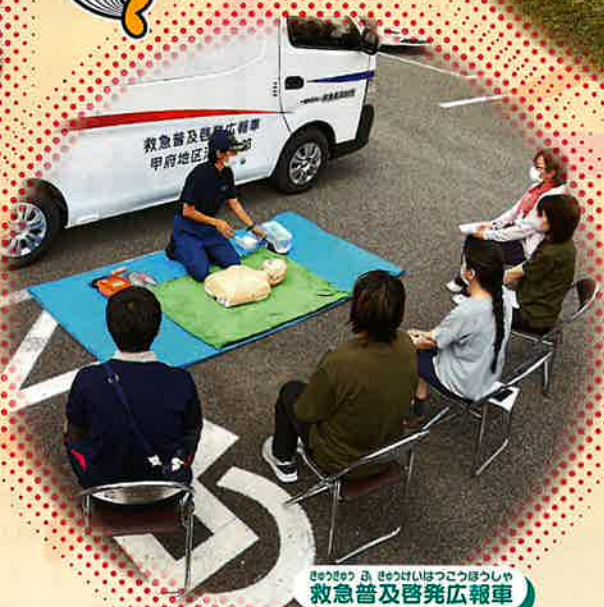
きゅうきゅう 救急普及啓発広報車