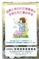
通り魔犯罪の被害者の遺児などに愛の手を

当基金は、公益財団法人として内閣総理大臣から認定を受けており、当基金に対する寄附金については税制上の優遇措置が受けられます。